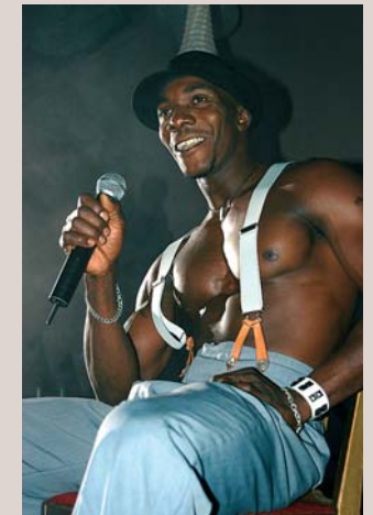
MrGay.dk's store show blev i år afholdt på Level Cph. d. 14. august. Germany vandt på sin naturlige og maskuline fremtoning.

Således er dette års konkurrence om titlen som MrGay.dk blevet en lille historie om, hvor lille en rolle nationalitet og oprindelse betyder for essensen af det at være dansk.